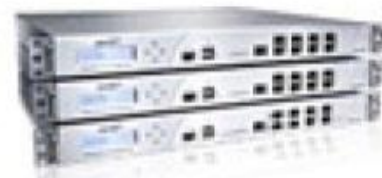
Série do NSA do E-Class de SonicWALL®

Não é limitado pelo tamanho do arquivo Tecnologia aproveita o processamento de vários núcleos de processamento Proteção contra ataques internos e externos