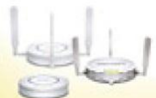
Série de SonicWALL® SonicPoint

Tecnologias IPSec e SSL VPN integradas Solução integrada com os recursos de segurança