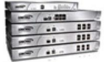
Série do NSA de SonicWALL®

Gateway Antivírus Gateway Antispyware Gateway Antispam Detecção e prevenção contra intrusão (IDS / IPS) Firewall de aplicação (Application Firewall) para controle granular das aplicações Filtro de conteúdo por categorias (CFS – Content Filtering Service) Logs e relatórios detalhados e centralizados