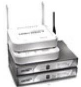
Série de SonicWALL® TZ

Tecnologia 802.11b/g/n de alta performance Solução integrada e centralizada para gerenciamento dos access points